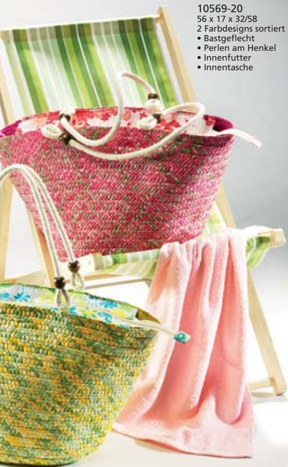
10569-20 56 x 17 x 32/58 2 Farbdesigns sortiert • Bastgeflecht • Perlen am Henkel • Innenfutter • Innentasche