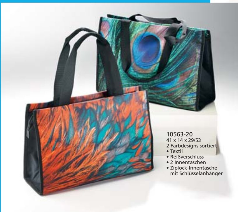
10563-20 41 x 14 x 29/53 2 Farbdesigns sortiert • Textil • Reißverschluss • 2 Innentaschen • Ziplock-Innentasche mit Schlüsselanhänger