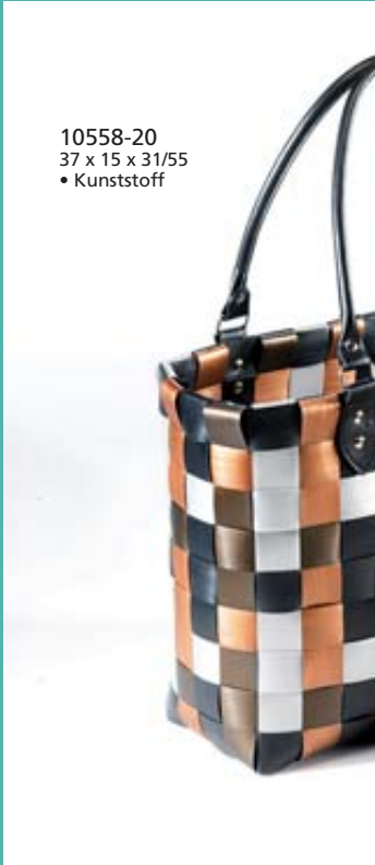
10558-20 37 x 15 x 31/55 • Kunststoff