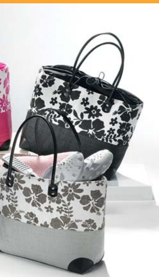
10567-20 46 x 16 x 24/47 3 Farbdesigns sortiert • Bastgeflecht • Holzkugeln am Henkel • Innenfutter • Innentasche