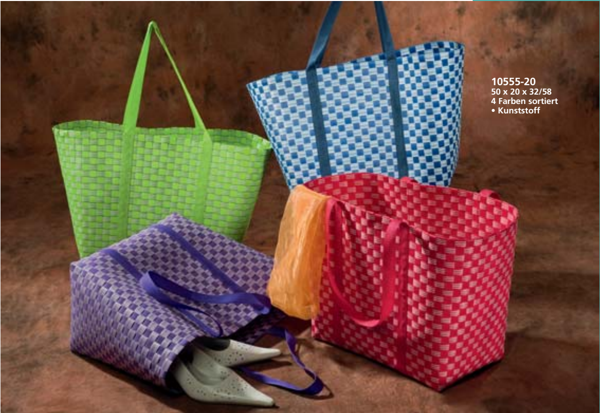
10555-20 50 x 20 x 32/58 4 Farben sortiert • Kunststoff