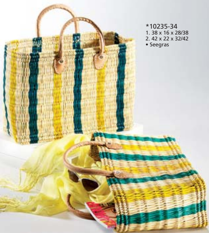
* 10235-34 1. 38 x 16 x 28/38 2. 42 x 22 x 32/42 • Seegras