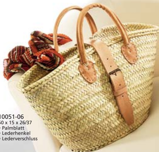
10051-06 50 x 15 x 26/37 • Palmblatt • Lederhenkel • Lederverschluss

Im Katalog aussuchen online bequem bestellen