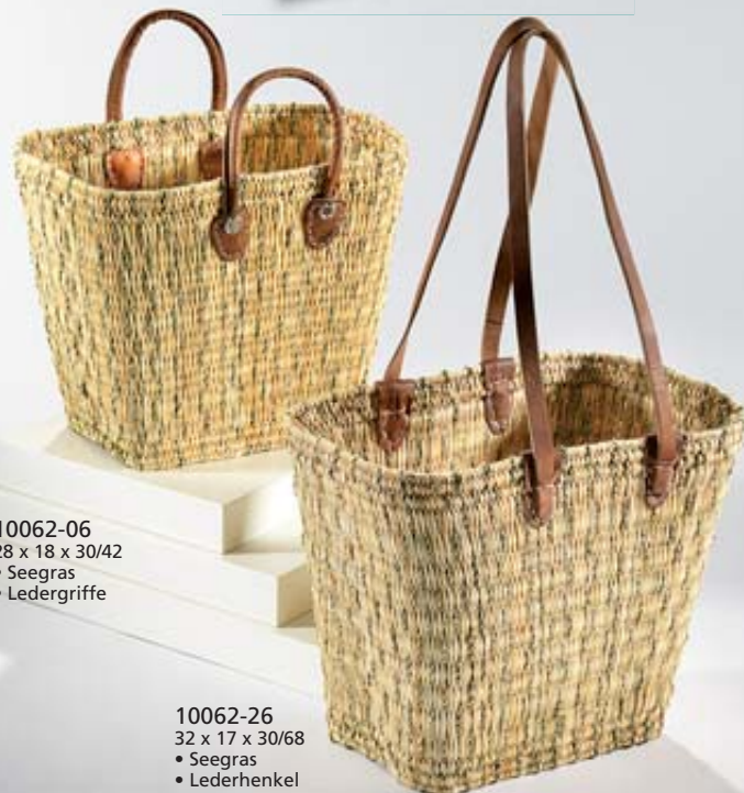
10062-06 28 x 18 x 30/42 • Seegras • Ledergriffe