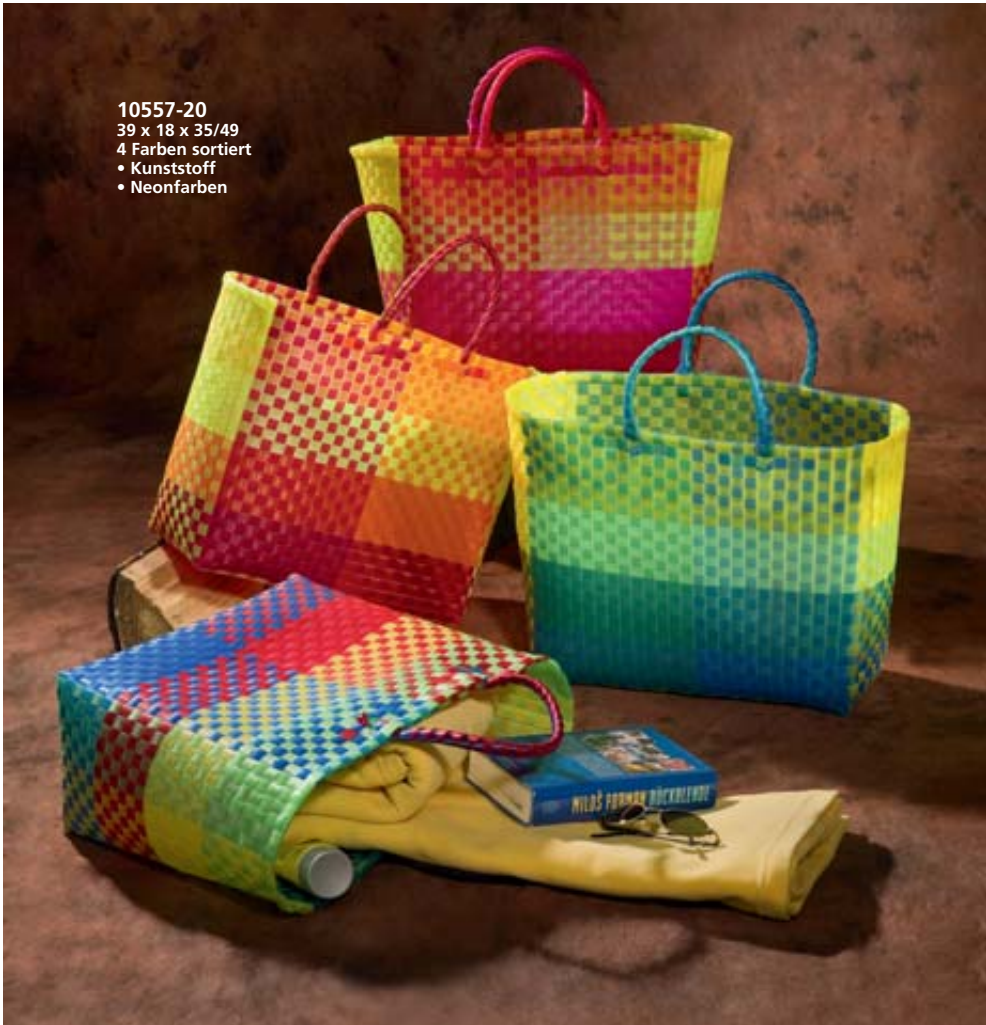
10557-20 39 x 18 x 35/49 4 Farben sortiert • Kunststoff • Neonfarben