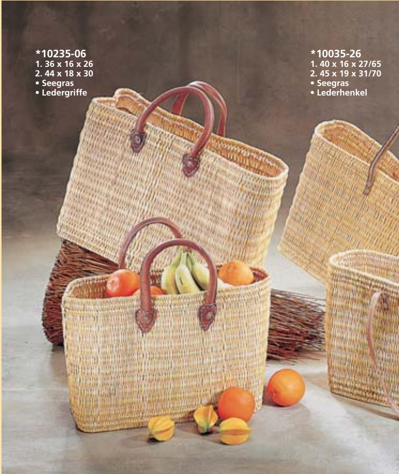
*10235-06 1. 36 x 16 x 26 2. 44 x 18 x 30 • Seegras • Ledergriffe