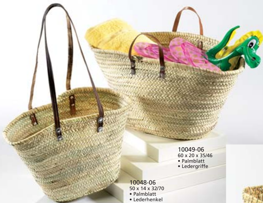
10049-06 60 x 20 x 35/46 • Palmblatt • Ledergriffe