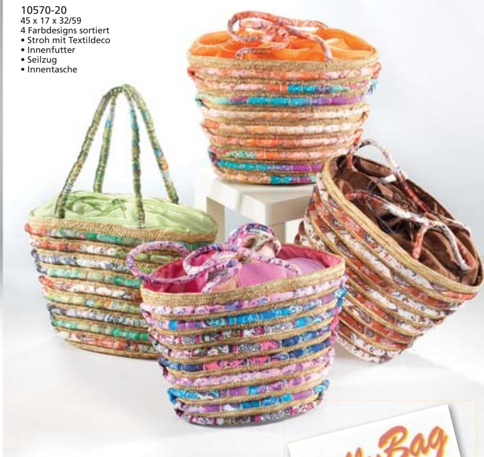
10570-20 45 x 17 x 32/59 4 Farbdesigns sortiert • Stroh mit Textildeco • Innenfutter • Seilzug • Innentasche