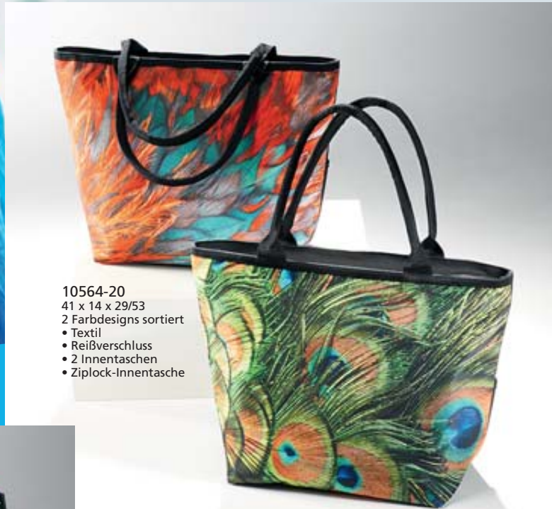
10564-20 41 x 14 x 29/53 2 Farbdesigns sortiert • Textil • Reißverschluss • 2 Innentaschen • Ziplock-Innentasche