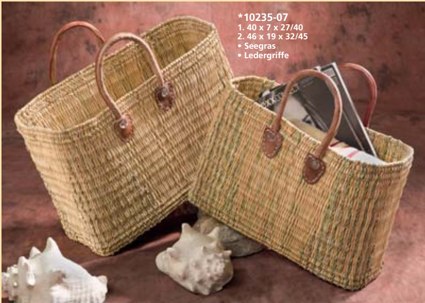
*10235-07 1. 40 x 7 x 27/40 2. 46 x 19 x 32/45 • Seegras • Ledergriffe