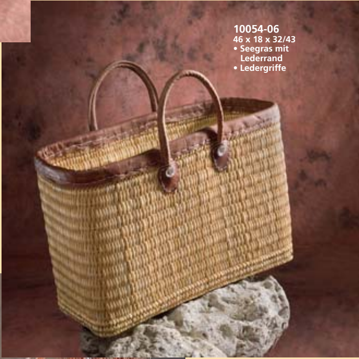
10054-06 46 x 18 x 32/43 • Seegras mit Lederrand • Ledergriffe