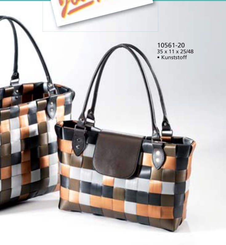
10561-20 35 x 11 x 25/48 • Kunststoff