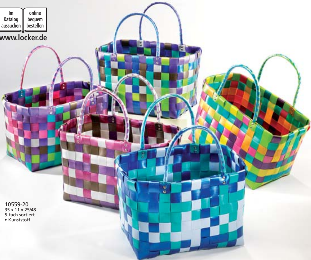
10559-20 35 x 11 x 25/48 5-fach sortiert • Kunststoff