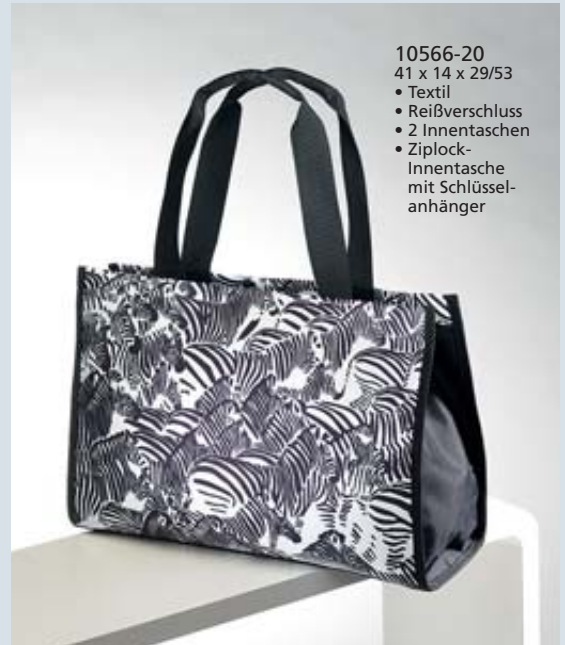
10566-20 41 x 14 x 29/53 • Textil • Reißverschluss • 2 Innentaschen • Ziplock-Innentasche mit Schlüsselanhänger