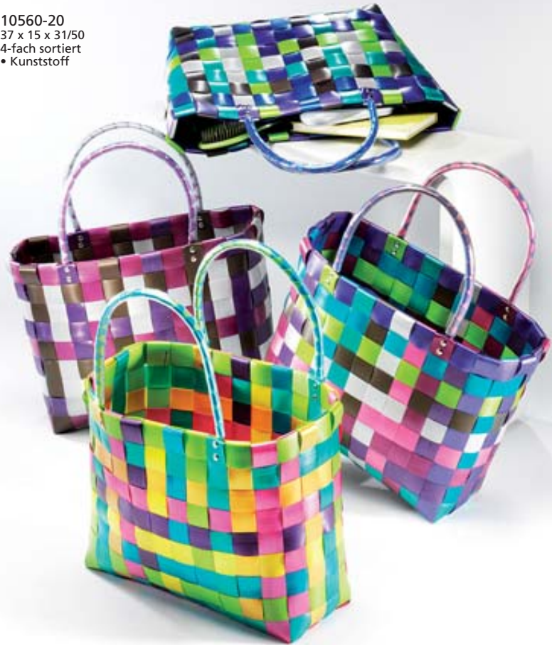
10560-20 37 x 15 x 31/50 4-fach sortiert • Kunststoff

Im Katalog aussuchen online bequem bestellen